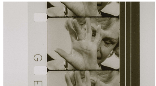
Leni Riefenstahl im CBC-Interview „Leni Riefenstahl in her own words“ (11.5.1965)

In Veiels vorhergehendem Film BEUYS (2017) wurden immer wieder Kontaktbögen mit Fotoaufnahmen im Überblick gezeigt. Die Kamera schwenkte in einer Suchbewegung hin und her, bis ein einzelnes Bild fixiert und näher heranzoomt wurde. Ein ähnliches Stilmittel wird auch in RIEFENSTAHL verwendet: Mehrmals sind Negativstreifen zu sehen, die auf einem Leuchttisch senkrecht herunterlaufen, bis die Bewegung plötzlich angehalten wird und ein einzelnes Einzelbild vergrößert zu sehen ist. Dieses Stilmittel steht sinnbildlich für das Vorgehen Veiels: Aus der Fülle des Nachlasses greift der