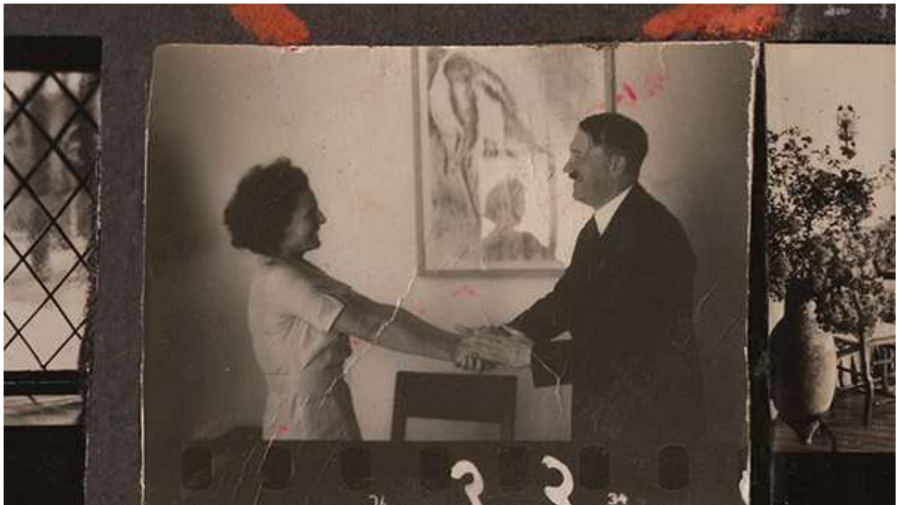
Adolf Hitler begrüßt Leni Riefenstahl in ihrer Villa in Berlin-Dahlem (1937)

Riefenstahl: Riefenstahl. – Anrufer: Nun, jetzt einmal wortwörtlich. Wenn ich das ganze Getue heute sehe, dann frage ich mich: Wer ist eigentlich ehrlich? Und ehrlicherer als eine Leni Riefenstahl es jemals war? Die kleine Frau, die da das Schönste vom Menschen dargestellt hat, und nicht die Krüppel! Die hat man verdammt und verurteilt und verfolgt. Das ist der Saustall in diesem Scheiß Staat! Und darum verurteile ich ihn! – Anderer Anrufer: Man muss eine gewisse Abklärung über diese ganze chaotische Zeit haben. [...] Und man muss sich klar sein, dass dieses Chaos ja kommen musste. [...] Es wird nicht so lange dauern, aber es wird noch ein, zwei Generationen dauern. [...] Und dann werden wir wieder zu Moral und zu Anstand und zu Sitte zurückkehren. – Riefenstahl: Ja, und das deutsche Volk hat ja die Anlage dafür.